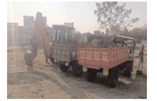
बाहेरच्या माफीयांचे तालुक्यात सर्रास अवैध उत्खनन सुरू

● सिटी न्यूज ब्युरो @ कारंजा ● कारंजा तालुक्यामध्ये अवैध गौण खनिज उत्खनन करणारी माफिया टीम सक्रिय झालेली आहे. बरेच माफिया बाहेरून येऊन तालुक्यामध्ये मोठ्या प्रमाणात अवैध उत्खनन करत आहे. याबाबत तक्रारी सुद्धा झालेली आहे. धंतालुक्यातील बऱ्याच ठिकाणचे अवैध उत्खननाचे प्रकार वृत्तपत्रातील बातमीच्या माध्यमातून उघडकिस येत आहे, तेव्हा तहसीलदार पासून ते तलाठी पर्यंत महसूल विभाग काय करतो, यांच्या मज्जीने हा सर्व प्रकार सुरू आहे काय असा प्रश्न सर्वसामान्य च्या मनात उपस्थित होत आहे. या अवैध उत्खननाबाबत काही वृत्तपत्रांमध्ये बातम्या प्रकाशित झाल्या त्यामुळे महसूल विभागाला जाग आली व त्यांनी कामगाव टाकळी शिवावर होत असलेल्या अवैध गौण खनिज उत्खननावर मोठी कारवाई केली, या कारवाईमध्ये एक जेसोपी व दोन ट्रॅक्टर