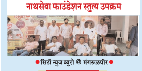
● सिटी न्यूज ब्युरो @ मंगरूळपीर ●

संत बिरबलनाथ महाराज यात्रा महोत्सवानिमित्त रक्तदान शिबिर