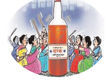
● सिटी न्यूज ब्युरो @ रिसोड ●

पिकांची मोठ्या प्रमाणात परेणी केली हा हरभरा राखण्यासाठी रातभरा जागरण करून शेतकरी थकला असता अचानक तास दोन तासातच वन्य प्राणी या शेतकऱ्यांच्या पिकांवर डल्ला मारून पिकांचे मोठ्या प्रमाणात नुकसान करत आहेत. शासनाने या शेतकऱ्यांच्या समस्या कडे गांभीर्याने लक्ष देऊन आर्थिक मदत व उपाय योजना करावी अशी मागणी शेतकरी वर्गातून जोर धरत आहे. अनेक वेळा या वन्यप्राण्यांकडून शेतकऱ्यांवर हल्ले झाल्यामुळे कित्येक शेतकरी जखमी झाल्याचे सुद्धा प्रकार घडले आहेत..