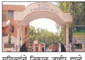
समित्यांचे निकाल जाहीर झाले. त्यामुळे अकोलासह प्रलंबित जिल्हा परिषदांचा निवडणूक कार्यक्रम कधी जाहीर होतो याची प्रतीक्षा आहे. ५० टक्केवर आरक्षण कळीचा मुद्दा ठरला आहे. अकोला, अकोटा, आणि मूर्तिजापूर पंचायत समितीच्या आरक्षणाची टक्केवारी ५० टक्के पेक्षा जास्त आहे. न्यायालयाने ही टक्केवारी ५० पेक्षा कमी हवी,

अकोला : जिल्हा परिषदेत राजकीय आरक्षणाची ५० टक्क्याची मर्यादा ओलांडल्याने निवडणुकीचा कार्यक्रम जाहीर होऊ शकला नाही. ओबीसी आरक्षणाच्या मुद्यावरून सध्या प्रकरण न्यायप्रविष्ट आहे. ही सुनावणी २३ फेब्रुवारी होण्याची शक्यता आहे. त्यामुळे सुनावणी झाल्यास निवडणुका जाहीर होणार काय, याकडे सर्वांचे लक्ष लागले आहे. राज्यातील १२ जिल्हा परिषद आणि १२५ पंचायत असे यापूर्वीच सांगितले आहे. पश्चिम विदर्भातील अकोला जिल्हा परिषदेत जानेवारी २०२५, अमरावती जिल्हा परिषदेत २२ मार्च २०२२ पासून, यवतमाळ जिल्हा परिषद आणि बुलडाणा जिल्हा परिषदेत तीन वर्षांपासून तर वाशीम जिल्हा परिषदेत एक वर्षांपासून प्रशासक राज आहे. तर, पूर्व विदर्भातील नागपूर जिल्हा परिषदेत १८ जानेवारी २०२५ पासून प्रशासक कार्यरत आहे. त्यामुळे २३ फेब्रुवारीला होणाऱ्या सुनावणीकडे या जिल्ह्यातील नागरिकांचे लक्ष लागले आहे.