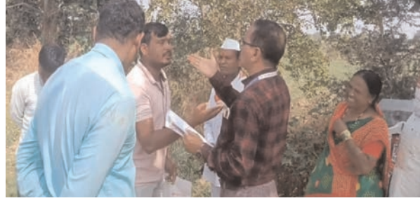
घालवे अशी अपेक्षा तालुक्यातील शेतकरी व्यक्त करीत आहेत.

आकांक्षीत जिल्हा म्हणून वाशीम जिल्ह्याची नोंद आहे. जिल्ह्यात मोठे प्रकल्प नाहीत ज्याचे जीवनमान शोतीवरच अवलंबून आहे. मात्र, शासकीय योजना खऱ्या शेतकऱ्यांपर्यंत पोहोचत नाहीत. न्याय मागणाऱ्या शेतकऱ्यांवरच अधिकाऱ्यांकडून अन्याय होत आहे. मंगरूळपीर तालुक्यातील गोगरी येथील शेतकऱ्याला कृषी अधिकाऱ्याने बुटाने मारहाण केली. शेतकऱ्याने येथील पोकराची तक्रार करणाऱ्या शेतकऱ्याला जीवे मारण्याची धमकी कृषी अधिकाऱ्याने दिली. तर आता वहीवाटीचा रस्ता मागणाऱ्या शेतकऱ्याला नायब तहसीलदारानी चक्क आत्महत्याकरण्याचा सल्ला दिला. यावरून जिल्ह्यात लोकशाही नसून अधिकारी शाही सुरू आहे. त्यामुळे मुख्यमंत्री देवेंद्र फडणविस साहेब 'देवा' अजब तुझा न्याय, न्याय मागणाऱ्या शेतकऱ्यांवरच होतोय अन्याय अशी म्हणण्याची वेळ शेतकऱ्यांवर आली आहे. कृषी मंत्र्यांच्या पालक जिल्ह्यातच अधिकाऱ्यांकडून छळ होत असून त्यांना कोणाचे बळ मिळत आहे अशी चर्चाही होत आहे.