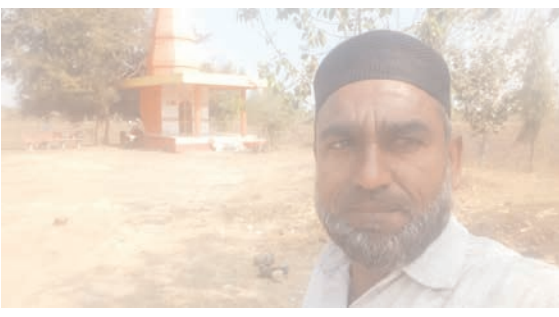
या संताप जनक प्रकारावर समाजातील सर्व स्तरावरून टीका होत आहे. तसेच परिवहन मंत्री यामध्ये कारवाई करतील का असा सवाल देखील उपस्थित होत आहे. प्रश्न विचारणाऱ्या

नागरिकांना अवैधरीत्या ताब्यात घेऊन गाडीत बसायला सांगणे तसेच त्यांना निर्जन ठिकाणी धोकादायक महामार्गावर सोडून देणे हा प्रकार एखाद्याच्या जीवाशी खेळण्यासारखाच नाही का