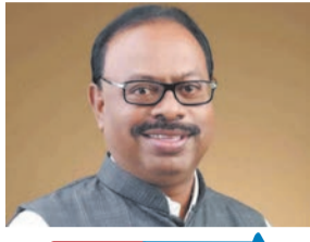
प्रतिनिधी ११ फेब्रुवारी

मुंबई : राज्याच्या जमीन महसूल कायद्यात मोठे बदल करण्यात आलाय. आता बिगर कृषी वापरासाठी जिल्हाधिकाऱ्यांकडून स्वतंत्र परवानगी घेण्याची आवश्यकता संपली असून, एन.ए. (नॉन-अग्रीकल्चरल) परवानगी घेण्याची सुद्धा गरज राहणार नाही. मुख्यमंत्री देवेंद्र फडणवीस यांच्या सूचनेनंतर महसूलमंत्री चंद्रशेखर बावनकुळे यांनी जमीन महसूल कायद्यात मोठा बदल केला आहे.